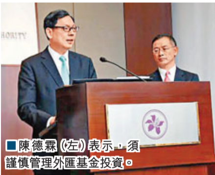
陳德霖(左)表示,須謹慎管理外匯基金投資。

最後,梁振英承諾,特區政府會維持香港的便利營商環境,吸引內地及外商投資香港,並會繼續投放大量資源,培育人才和基礎設施及推動高增值的商業活動,全方位提高香港競爭力,同時亦會提供健全的規管架構,保持香港繁榮,確保香港繼續按市場經濟原則運作。