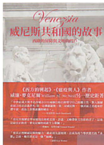
《威尼斯共和國的故事》

威尼斯的擴張與拜占庭相關，後者的中央政府因為地主貴族割據而衰落，這些奢侈的地主貴族就與威尼斯進行大額貿易；日後威尼斯衰落固然是因為地中海航線沒落所致，但這亦由於鄂圖曼海軍勢力對威尼斯