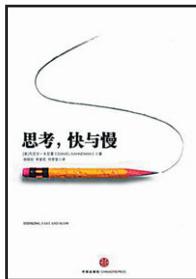
《思考，快與慢》，中信出版社 2012年7月第1版。該書繁體版由台灣天下文化出版，譯名為《快思慢想》

卡尼曼還舉了很多生動直觀的例子用以說明他的觀點，譬如「手術後一個月內的存活率是95%」的說法要比「手術後一個月的死亡率是5%」更令人安心。同樣，說涼菜「85%不含脂肪」要比說「15%含有脂肪」更具吸引力等等。這些都是「系統1」直接影響