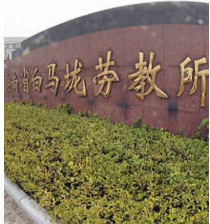
湖南白馬壩勞教所外景。資料圖片

報道引述人權觀察組織高級研究員Nicholas Bequelin指，目前風險之處在於，中國或出台懲罰力度較柔和的勞教制度，令警方不經司法審判就長時間剝奪公民人身自由的制度永久化，而該變相勞教制度將更難廢除。