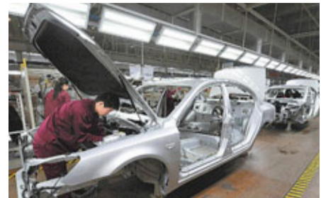
圖為安徽江淮汽車生產線。資料圖片

香港文匯報訊 德國《世界報》網站5日刊登《中國藉「外力」打造汽車大國》文章指，全球正值汽車品牌倒閉潮，中國卻大力打造新品牌，通過採取與過去幾十年不同做法，試圖在全球汽車業中分一杯羹。文章指，中國不乏本土汽車企業，但欠缺品質和創新型好車。