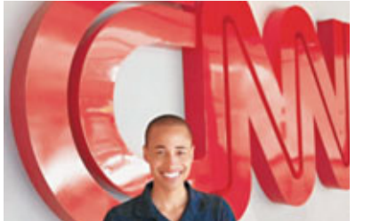
倍，但移居大城市亞特蘭大，房租貴，於是上網費、電話費開刀，又經常留意超市優惠，減少支出，又不敢開冷氣或暖氣，體重一度降至115磅。

他每日輪班10至12小時，堅持不吃正餐，只靠營養補充劑及蛋白棒維持能量，逢周日花5美元(約39港元)吃一頓麥當勞早晨全餐已是最奢侈開支。半年後，他如願供完車，噩夢才真正降臨，他意識到未來10年每月要償還235.65美元(約1,827港元)學貸，以目前收入只能過赤貧生活。他毅然轉職美國有線新聞網絡(CNN)任助理監製，時薪雖大增一