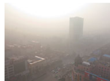
安徽省阜陽市城區被大霧籠罩。