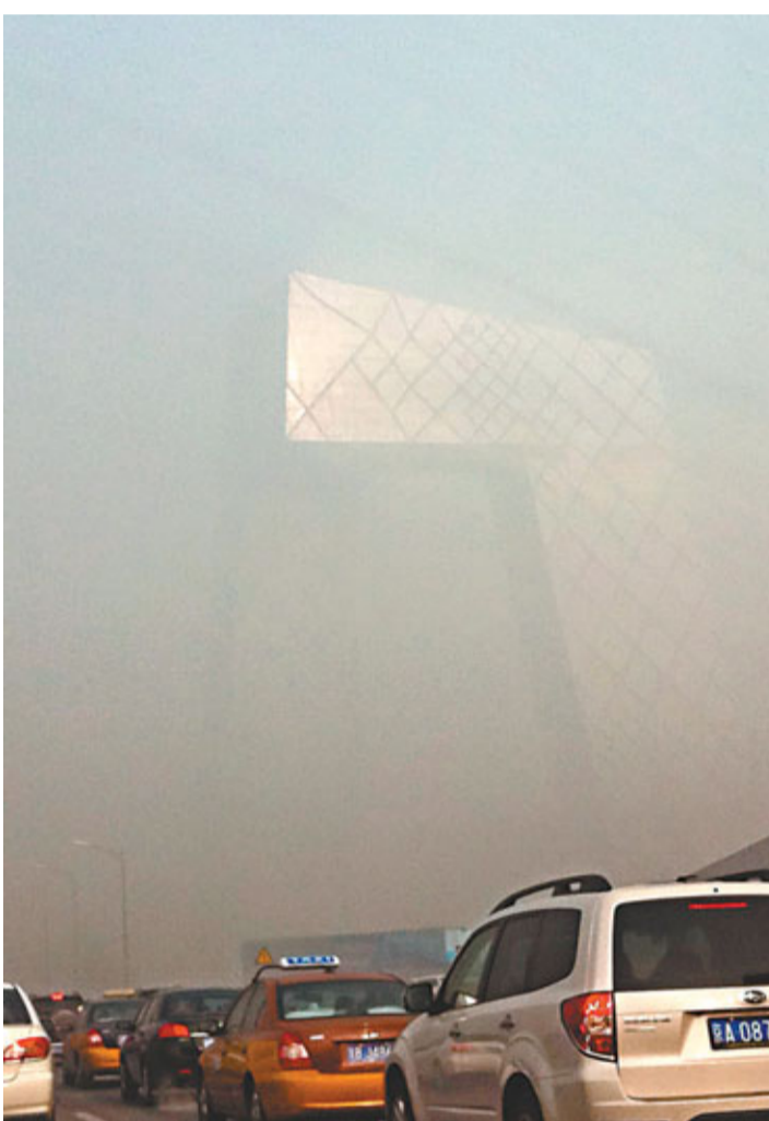
濃霧罩北京，「大褲衩」只見褲腰，褲腿沒了。

此外，山東、河北、河南、湖北等地的多個城市空氣質量也都為嚴重污染，PM2.5及PM10監測指數達到頂峰數值。中央氣象台12日將大霧預警升級為黃色：預計12日夜間到13日，京津地區、河北東部和南部、山東西部和半島地區、河南東部、蘇皖北部、四川盆地、重慶西部、湖北東部、湖南東部和南部、貴州西部和南部、雲南東南部、廣西北部等地有能見度不足1000米的霧，部分地區能見度不足200米。