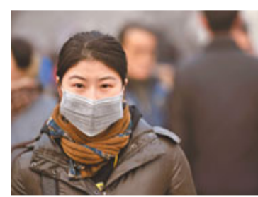
北京市民需戴口罩，全副武裝出行。