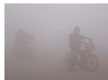
河南鄭州出現局部地區能見度小於200米的大霧天氣。