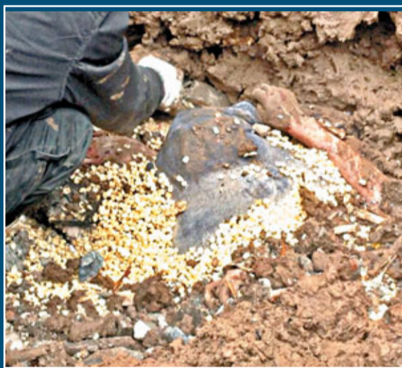
被埋在泥沼裡的村民。