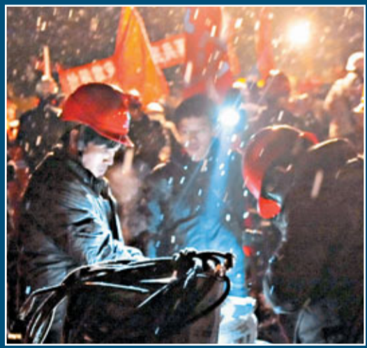
供電人員在為救援現場提供臨時電源。

香港文匯報訊 昭通市鎮雄縣地處烏蒙山國家扶貧開發試驗區,貧困人口眾多,自然條件惡劣,也有不少香港企業和機構到這裡開展公益項目和活動。據了解,香港「苗圃行動」2000年進入昭通資助,現在在昭通共援建了148所學校,其中彝良縣27所、鎮雄縣12所。在本次山體滑坡的地區附近也有「苗圃行動」的小學,但由於事故地點距離學校20公里左右,對學校沒有造成影響。