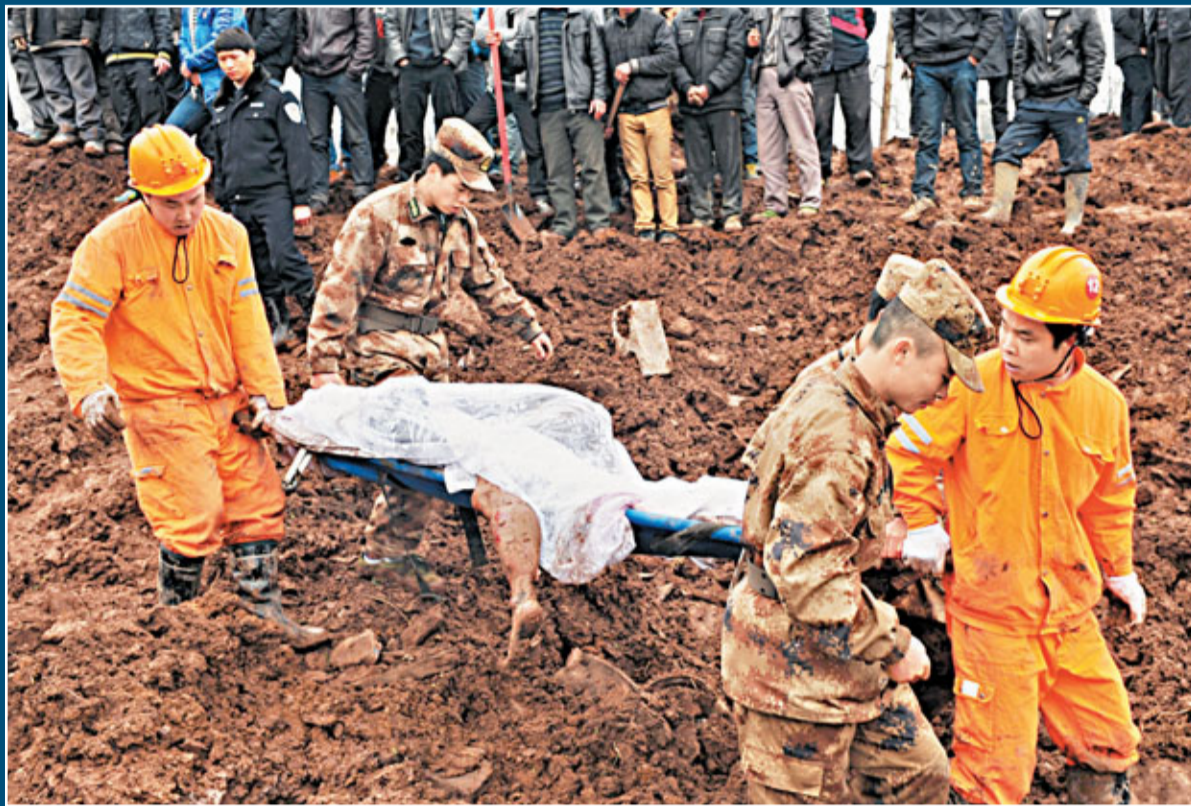
救援人員在救援現場搬運遺體。

據雲南省鎮雄縣「1·11」山體滑坡搶險救災指揮部消息,省、市和縣三級財政已安排1000餘萬元用於應急搶險救災,受滑坡威脅的57戶群眾得到緊急轉移安置,每名遇難者的家屬初步安排撫慰金1萬元。