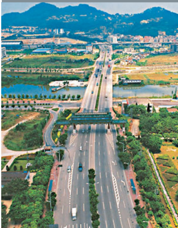
穗將加快發展南沙新區。

香港文匯報訊(記者 古寧 廣州報導)廣州市委十屆四次全會日前傳出消息,廣州市決策層確定了今年100項廣州市重點督辦工作,並計劃舉全市之力進行重點保障、重點督導、重點考核。其中,今年擬投資210億元加快南沙建設步伐,資金來源包括財政資金、企業自籌和銀行貸款。