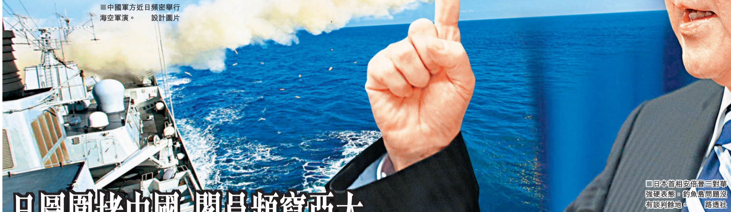
日本首相安倍晉三對華強硬表態，釣魚島問題沒有談判餘地。