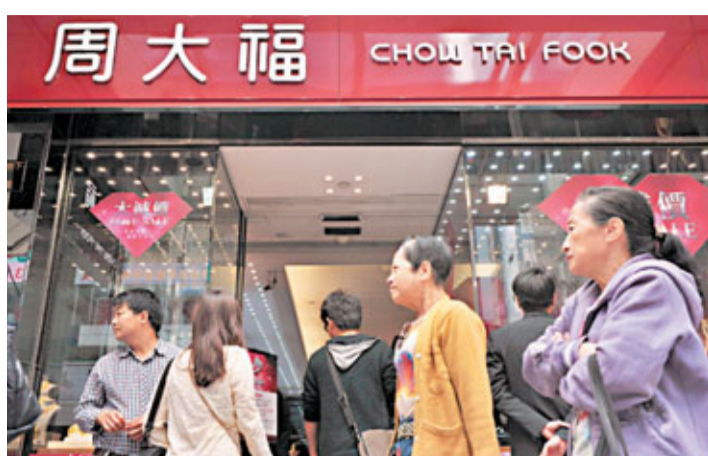
周大福料本年在農曆新年刺激下,同店銷售可望有低單位數增長。

展望第4季,周大福指,去年11及12月消費信心有所改善。而農曆新年為傳統旺季,該公司會加大力度,進行鑽石及珠寶推廣活動,令消費該類產品的客戶增加,預料第4季同店銷售有低單位數增長,不過內地銷售復甦