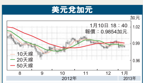
1月10日 18:40 報價: 0.9854加元

周三紐約商品期貨交易所2月期金收報1,655.50美元,較上日下跌6.70美元。現貨金價本週初在1,643美元附近獲得較大支持後,已一度於本週三反覆走高至1,666美元附近,受到美元於本週四走勢偏軟影響,預料現貨金價將反覆走高至1,680美元水平。