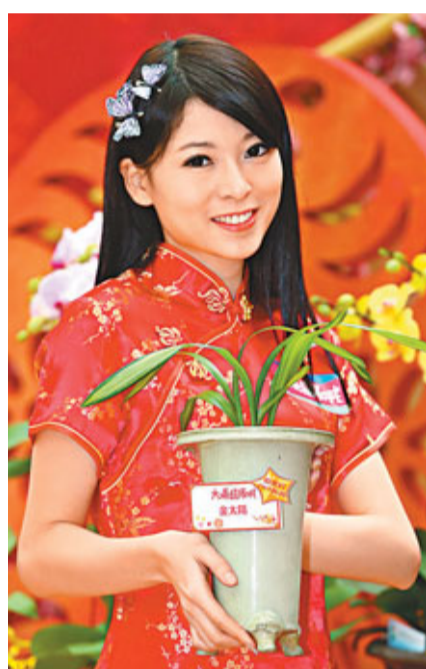
模特兒手持價值港幣80萬至100萬元的金太陽蘭花。