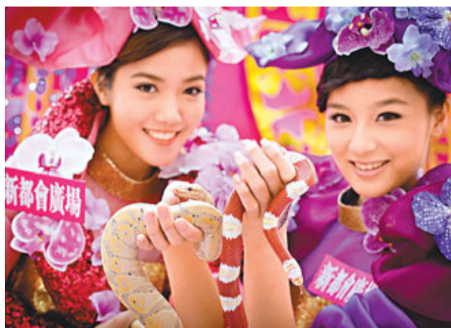
雄性香蕉球蟒(左)在港首展，身價超過60萬元。

香港文匯報訊(記者 王維實)農曆新年臨近，有商場為迎合蛇年到來，新春期間展出身價逾60萬的稀世「香蕉球蟒」及其他7條靈蛇，期望吸引更多人流。亦有商場展出價值逾