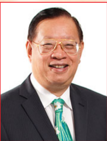
譚學林博士太平紳士，AIA英國總會前會長及現任理事，AIA香港分會經濟發展委員會主席。