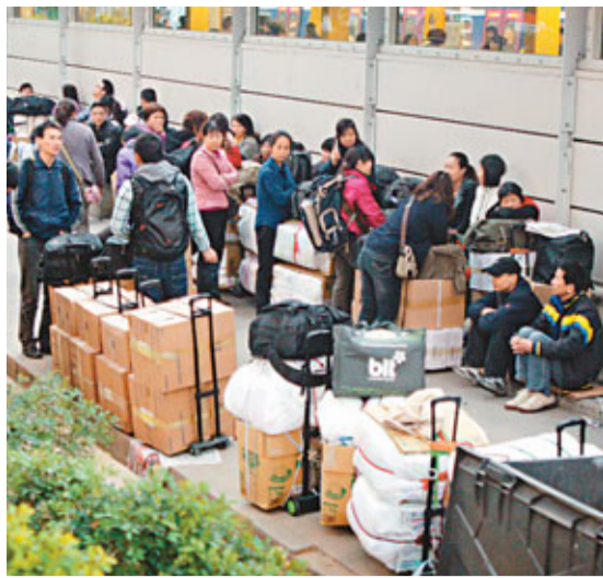
內地與香港合作打擊水貨客去年已取得很大的成績。圖為香港水上水貨站外的水貨客。資料圖片

此外，深圳海關有關負責人近期亦表示，下一步該關將在鞏固前期打擊成果的基礎上，繼續緊密與港方聯繫配合，保持對「水客」走私的高壓打擊態勢，持續整治口岸秩序，為廣大進出境旅客營造更加穩定便捷的口岸通關環境。