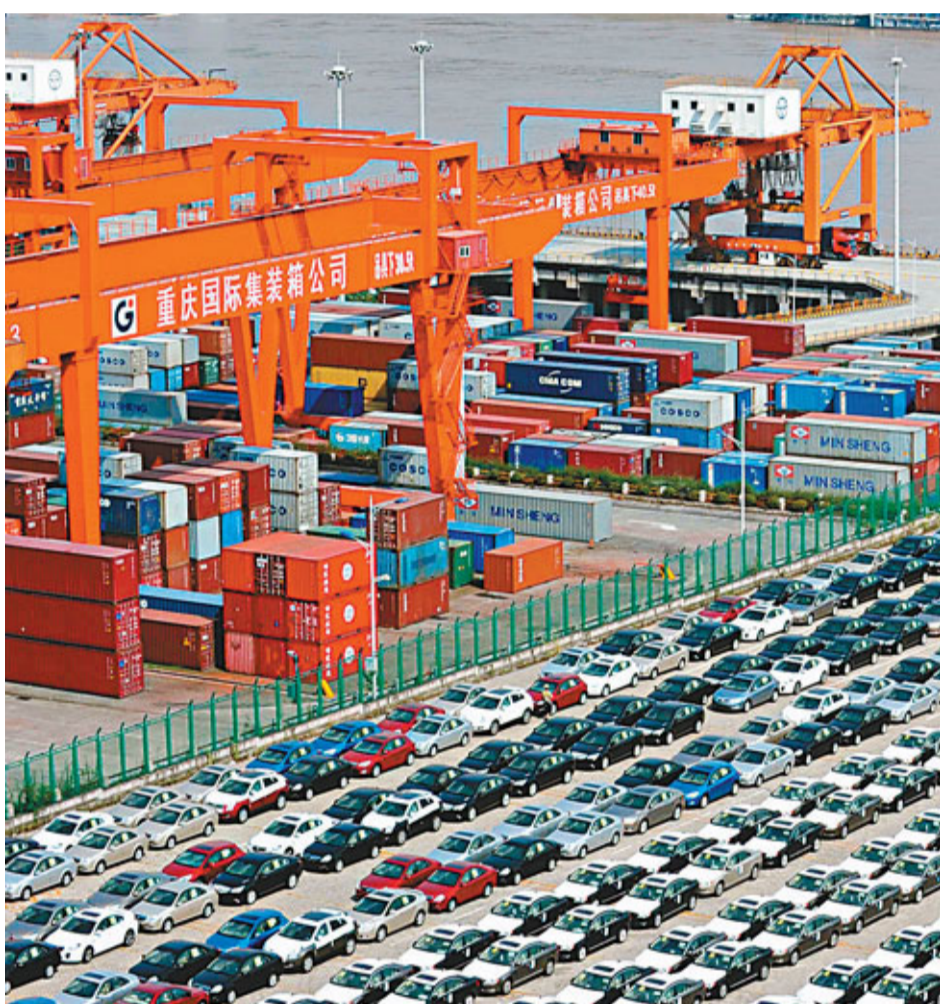
內地去年12月出口增長創出7個月來高位。圖為重慶兩路寸灘保稅港區一角。

鄭躍聲又表示，去年外貿增速雖有所回落，但在提升質量、提高效率、優化結構等方面取得明顯進展：一是貿易夥伴的多元化更明顯；二是國內貿易區域的佈局更均衡；三是對外貿易的主體結構更趨合理；四是國家的出口商品結構繼續升級；五是進口商品的結構進一步優化；六是外貿方式更趨靈活；七是質量提升、效益提高的表現，使中國的貿易價格條件有所改善，出口價格總體在上漲，進口價格總體在下降。