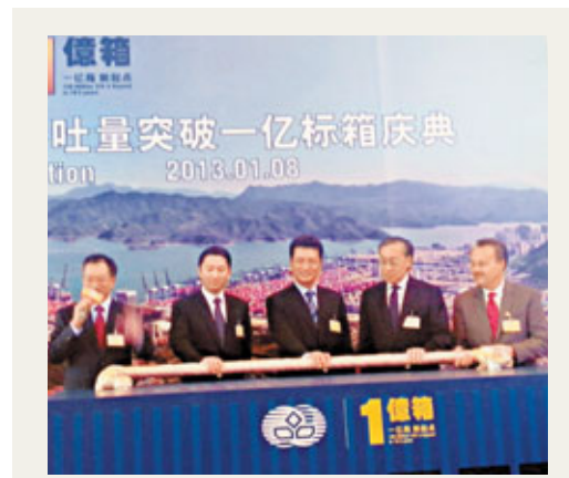
鹽田國際舉行破億標箱慶典。

至於歐美經濟,廖群指兩者現時「都在無限寬鬆,不達目的誓不罷休」,雖然長期效果負面,但短期有積極作用。預計歐債危機大致可穩定,歐洲經濟將零增長或是微弱正增長;美國也不會「墮崖」,將會分階段解決財政問題,美國今年經濟增長2.2%至2.3%。