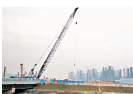
前海今年會全面開展基礎設施建設,各項優惠政策的細則也將陸續落地。

香港文匯報訊(記者 李望賢 深圳報導)繼前海跨境人民幣貸款細則出臺之後,前海企業稅優惠目錄也將於近期公布。前海的財稅優惠政策一直是入駐企業關注的焦點。按照此前國務院批覆