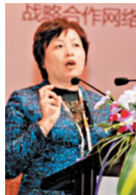
住建部政策研究中心主任秦虹。2013年樓市調控方向不變、力度不減。

香港文匯報訊(記者 古寧 廣州報導)住建部政策研究中心主任秦虹9日在廣州舉行的「城市觀點論壇中國行2012年度論壇」演講時預計,2013年房地產市場有望繼續保持以穩為主,小幅的波動。同時表示,城鎮化對房地產的影響至少在2013年影響是中性的,而不應該像一些人過分那麼樂觀。對於今年房地產調控政策,她的一個基本判斷就是方向不變、力度不減。所以沒有理由期望在抑制投資、投機方面有所放鬆。