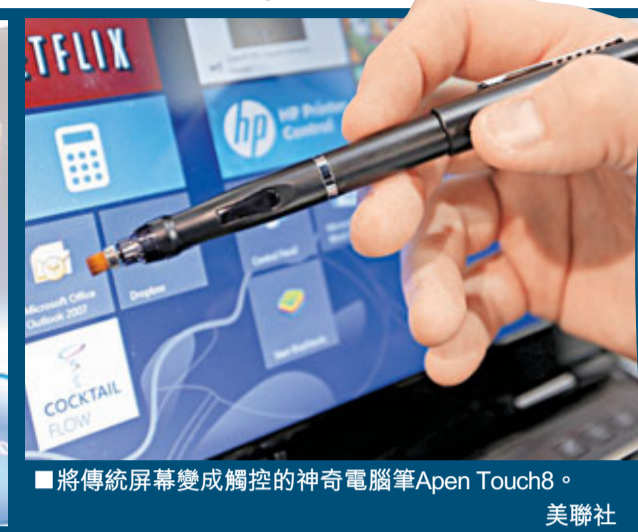
將傳統屏幕變成觸控的神奇電腦筆Apen Touch8。