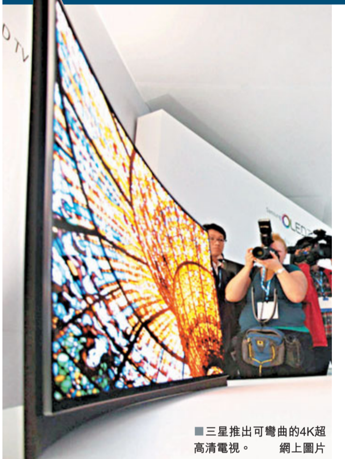
三星推出可彎曲的4K超高清電視。

買電視買高畫質？Out了，2013年注定是4K超高清電視的時代！正在拉斯維加斯舉行的2013年國際消費電子展（CES）中，索尼、Panasonic、聲寶、三星及LG等大廠紛紛端出最尖端的4K電視，以超清晰的影像震撼眼球之餘，還要用超高售價吸乾消費者荷包！