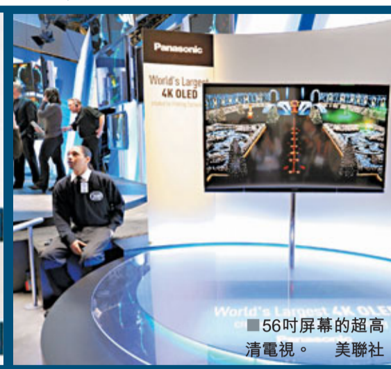
56吋屏幕的超高清電視。