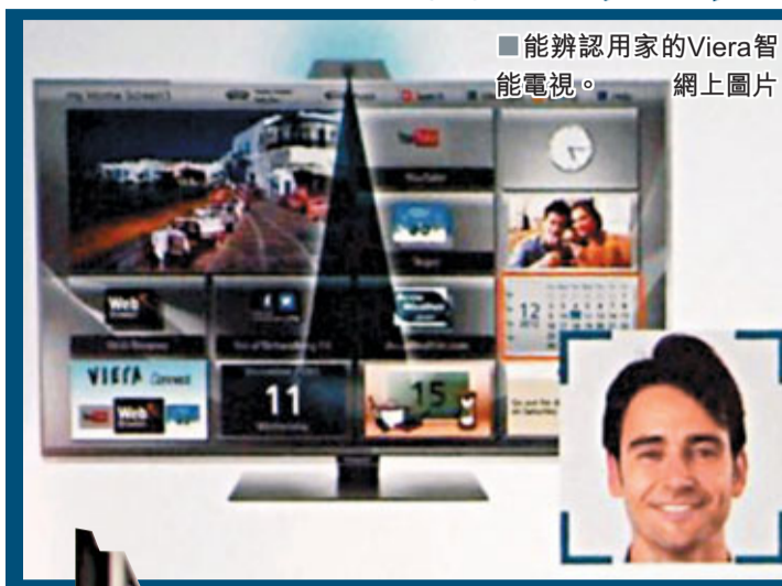
能辨認用家的Viera智能電視。網上圖片