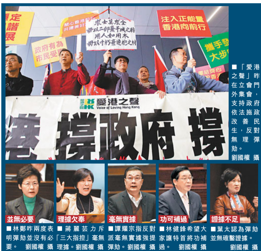
「愛港之聲」昨在立會門外集會，支持政府依法施政改善民生，反對無理彈劾。

香港文匯報訊(記者 鄭治祖)為阻撓特區政府施政，反對派半年來對特首梁振英的大宅僱建事件窮追猛打，在提出不信任動議、引用特權法查僱建被否決後，反對派27名議員昨日在立法會大會上聯署動議彈劾梁振英的議案，稱梁振英多次就大宅僱建作出虛假及誤導陳述，並無誠實回應立法機關質詢，完全違反特首應遵守的法律及廉潔奉公等憲制責任，涉嫌嚴重違法及瀆職。建制派議員批評，彈劾議案毫無真憑實據，但反對派為求發動第三輪攻擊而強行彈劾，旨在阻撓施政前行，寄語大家放低爭拗，讓施政重回正軌。議案最終被否決。