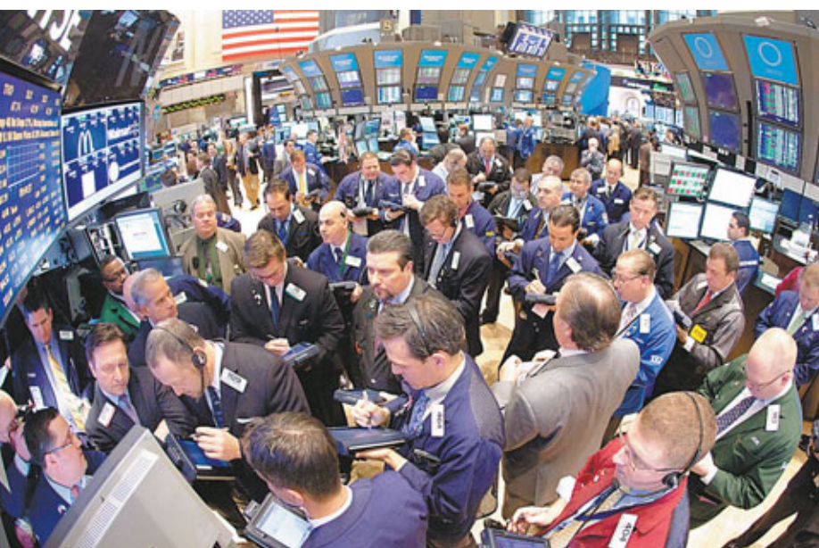
■回顧2012年，環球市場大起大落，傳統基金表現突出，對沖基金的表現卻遜預期。圖為紐約交易所交易大堂。