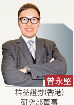
群益證券(香港)研究部董事