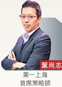
第一上海首席策略師

恒指出現低開低走，日內跌幅超過200點，是12月份以來的最大單日跌幅，獲利回吐的操作來得比較明確，相信恒指的短期升勢已有基本到位的可能，大盤將會進入漲後整固的階段。恒指收盤報23,111，下跌219點，主板成交量有827億多元，其中有62億多元是涉及太保(2601)的配股交易。技術上，經過了周一下跌回整後，恒指的