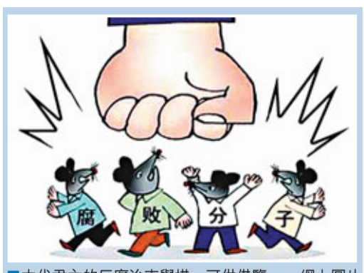
古代君主的反腐治吏舉措，可供借鑒。

杖七十，每五貫加一等，八十貫則處以絞刑。受財不枉法者，一貫以下杖六十，每五貫加一等，至一百二十貫杖一百，流放三千里；後改為受財四十貫就流放。若貪至六十兩以上白銀者，不但梟首示眾，還要剝皮實草（將皮剝下來，頂上稻草，掛在公堂旁示眾）。