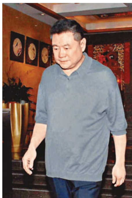
劉鑾雄是名人飯堂「福臨門」的常客。