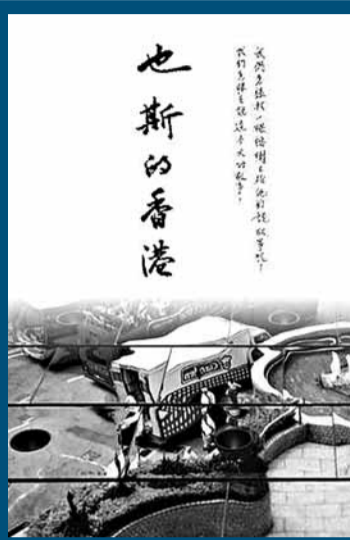
也斯影集《也斯的香港》。資料圖片