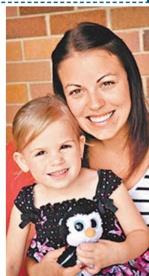
扎拉手部被巨蟒咬了三口，幸傷勢輕微。網上圖片 吉特利母女平安，也多得家貓幫助。網上圖片