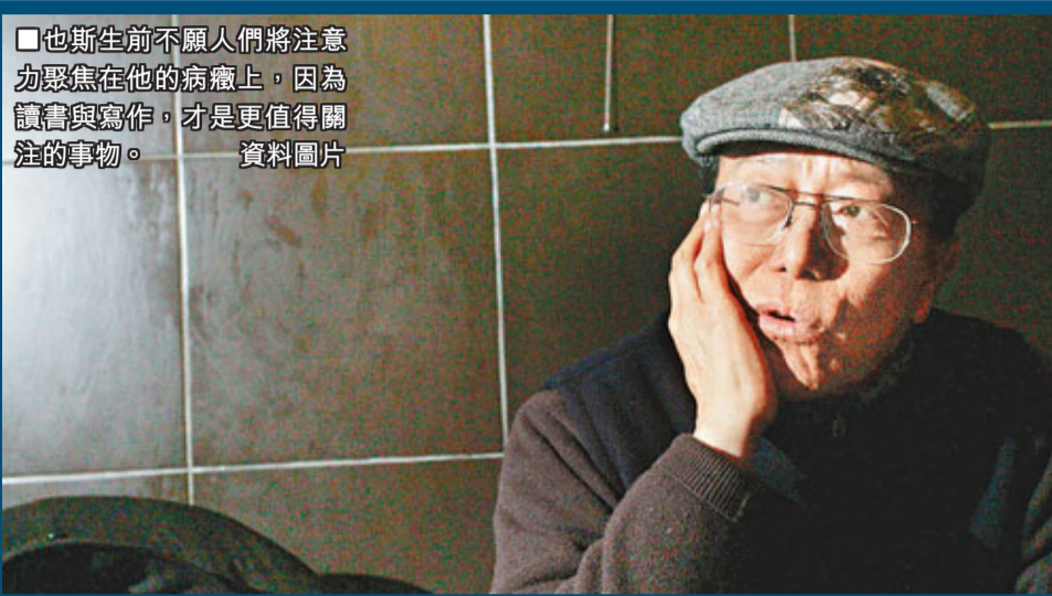
也斯生前不願人們將注意力集中在他的病榻上，因為讀書與寫作，才是更值得關注的事物。資料圖片