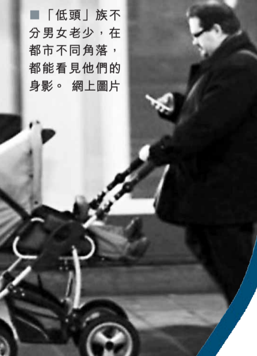
「低頭」族不分男女老少，在都市不同角落，都能看見他們的身影。

手機設計日新月異，上網功能、應用程式、遊戲以至銀行服務均帶來便利，又能傳送即時訊息、拍照及分享片段等，讓分隔兩地的親友保持聯繫。不過，當人淪為「低頭族」，只懂埋首看影