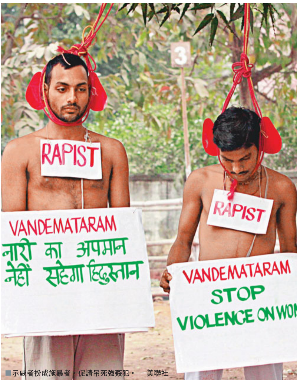
示威者扮成施暴者 促請吊死強姦犯。