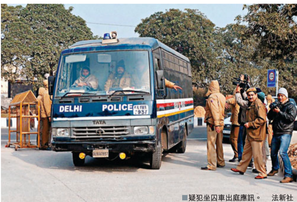
疑犯坐囚車出庭應訊。

印度巴士輪姦案5名成年被告昨在首都新德里的法院首次提堂，被控謀殺、綁架、搶劫及串謀襲擊等逾10項罪名，一旦罪成可判死刑。有兩名被告申請轉為污點證人，換取較輕刑期，另一17歲被告則被安排在少年法庭受審。