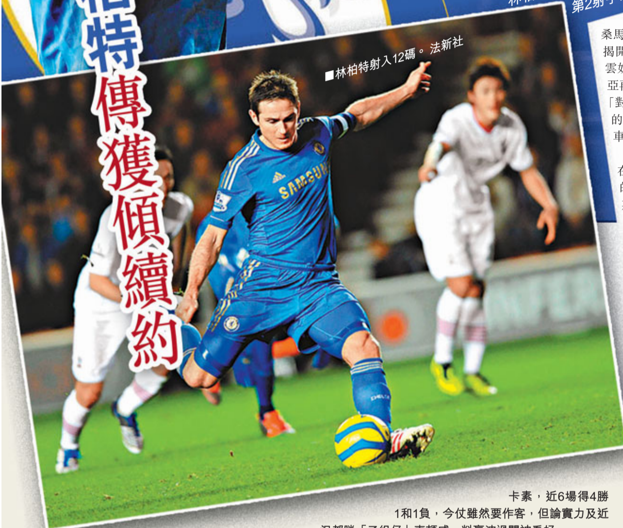
■林柏特射入12碼。