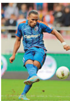
■阿仙奴領隊雲加。

祖雲達斯一直否認他們想引進杜奧巴，在5日舉行的新聞發佈會上，主教練干地再次表示，球會裡沒人提議引進杜奧巴。