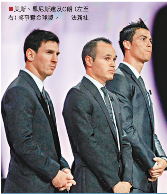
■美斯、恩尼斯達及C朗(左至右)將爭奪金球獎。

香港時間8日，2012年國際足協金球獎頒獎典禮將在瑞士的蘇黎世舉行，加冕者會從美斯、C朗、恩尼斯達當中產生。作為金球獎三甲之一的C朗，他覺得自己有必要赴會，哪怕加冕希望遠不及美斯也是如此；不過C朗如同皇馬教頭摩連奴唱反調，該名年度最佳教練的候選人表示自己不會出席金球獎頒獎典禮。