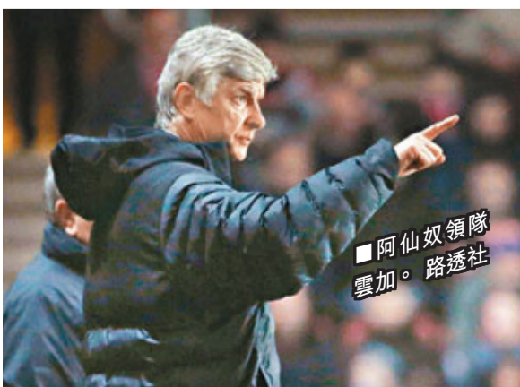
■阿仙奴領隊雲加。路透社

雲加說：「我們阿仙奴球員之間的薪水不會相差太遠，我們更像是一種社會主義模式，我們也因此備受批評，但我們也會有好處，我們可以避免球員之間的攀比，我們也會有例外，但例外的球員拿到的薪水也不會跟其他球隊一樣高，我們花了很多錢去支付薪水，我們努力想要盡可能利用好這些錢。」 ■香港文匯報記者 梁啟剛