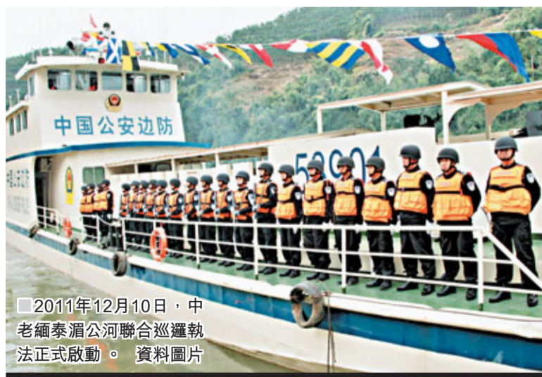
■2011年12月10日，中老緬泰湄公河聯合巡邏執法正式啟動。資料圖片