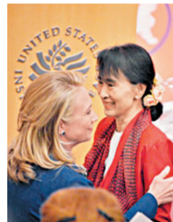
■緬甸反對黨領袖昂山素姬強調緬甸與美國改善關係，並不代表緬甸與中國的關係會倒退。圖右為昂山素姬。資料圖片

當西方國家的企業、個人，以及非政府組織在緬甸愈趨活躍，緬甸絕對有可能把本屬國內與中國之間的利益矛盾，轉化為西方在緬甸勢力與中國的矛盾，化解緬甸政府來自中國的壓力。在2012年11月，緬甸發生群眾事件，大批民眾搭建帳篷，阻止中緬合作建設的萊比塘銅礦項目，最後爆發警民衝突。民眾指責，銅礦開採令部分民眾家園盡毀，破壞環境，中國企業並未向居民作出應有的賠償。中國官方媒體反指，事件是西方勢力滲透緬甸的非政府組織，由非政府組織煽動所引起。無論誰是誰非，緬甸成功避免與中國直接衝突，確保中國在外交、經濟、軍事上的支持。