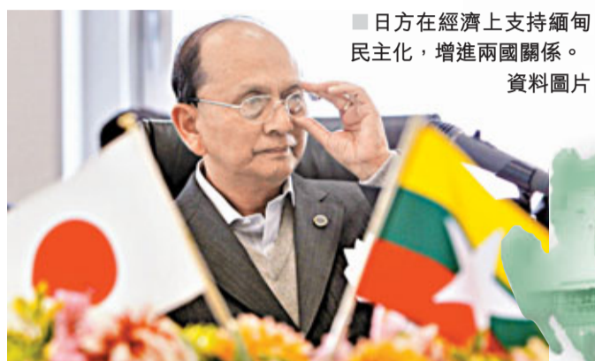
■日方在經濟上支持緬甸民主化，增進兩國關係。資料圖片