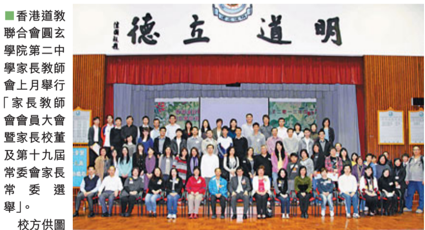
香港道教聯合會圓玄學院第二中學家長教師會上月舉行「家長教師會會員大會暨家長校董及第十九屆常委會家長常委選舉」。

港大昨日在百周年校園李兆基會議中心舉行銘謝禮,感謝李兆基2007年捐贈5億元予港大,支持校園發展和成立獎學金。港大當時以一半捐款用作學校百周年校園西部發展計劃的經費。李兆基會議中心是發展項目其中之一,現已落成啟用。該中心設有能容納1,000人的大會堂,並配置專業標準音響系統,適合舉辦各種學術文化活動及支援課堂。會議中心包括26間演講廳、課室和黑客劇場。