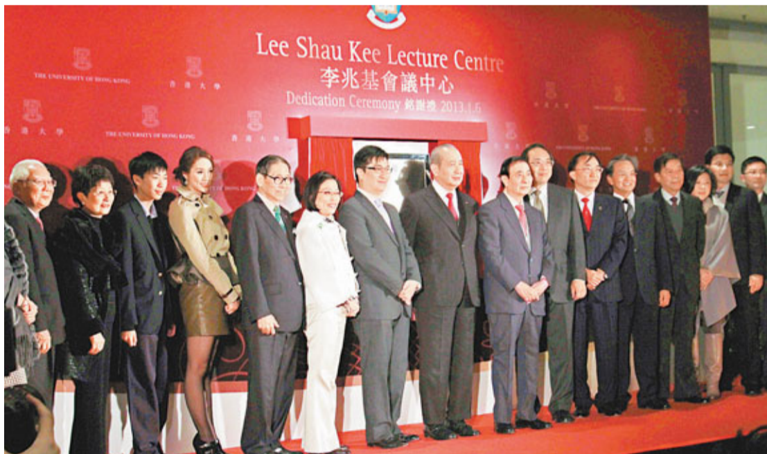
港大昨日在百周年校園李兆基會議中心舉行銘謝禮,感謝李兆基2007年捐贈5億元予港大,支持港大校園發展和成立獎學金。

香港文匯報訊(記者 馮晉研)香港大學早年獲恒基兆業地產集團主席李兆基(四叔)捐贈5億元,發展百周年校園及設立獎學金,其中一項工程——李兆基會議中心近日啟用,校方昨日舉行銘謝禮,答謝李兆基對大學的幫助。李兆基致辭時表示,「賺錢要成功,花錢亦要成功」,直言當恒生指數升至3萬點,就會每年捐出10億元作公益用途。