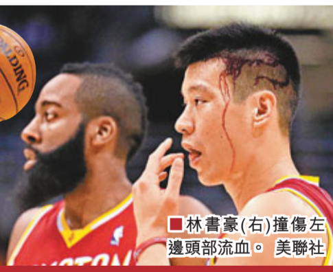
■林書豪(右)撞傷左邊頭部流血。