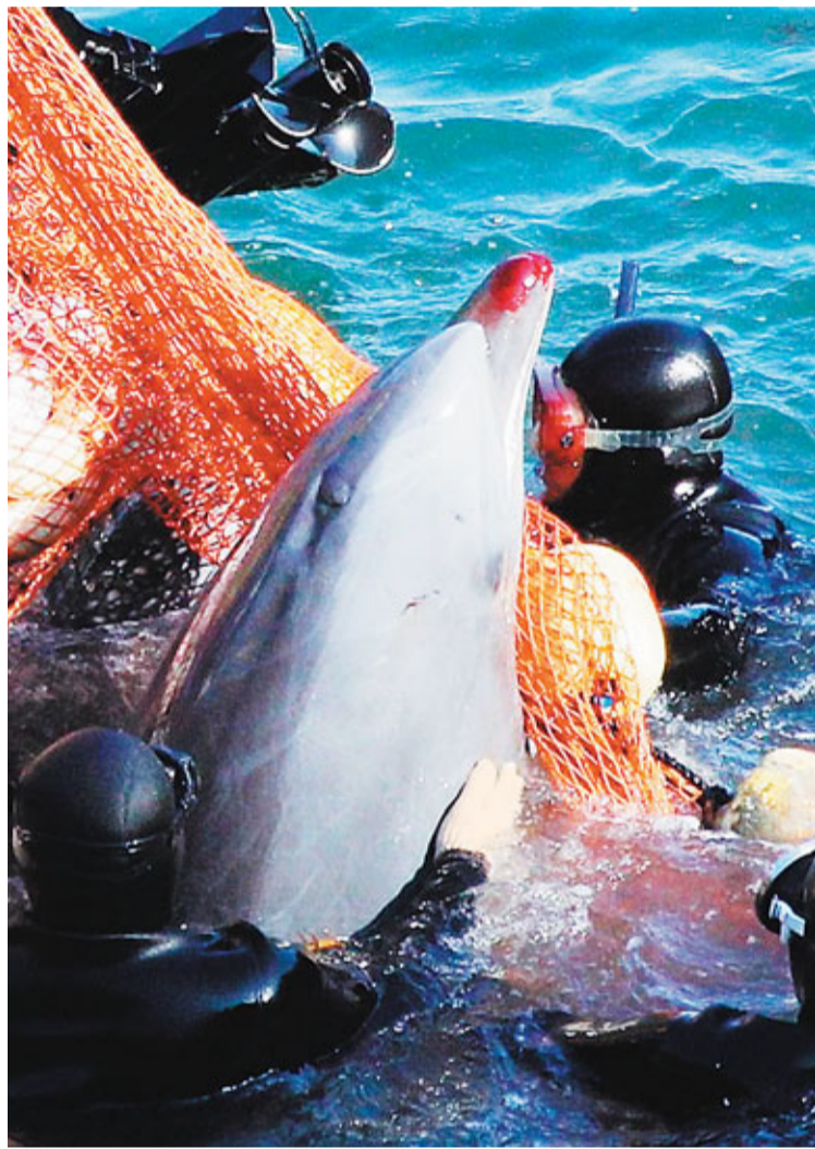
除「僥倖」獲挑出售的海豚，其餘全都會被宰。

奧斯卡得獎紀錄片《海豚灣》兩年前引起大眾反思濫殺鯨豚，然而日本和歌山縣太地町獵捕鯨豚的傳統至今依舊不變。不少健康的野生海豚落入漁民手中後，以每條5萬至10萬英鎊(約62萬至125萬港元)的價錢，售予世界各地的水族館、賭場或主題樂園。然而訓練鯨豚表演或將之困在水族館，完全違反其天性，牠們會因而抑鬱甚至自殺。