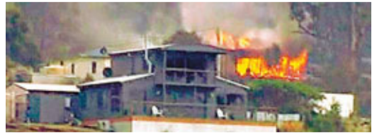
澳洲的高溫令山火蔓延。

受強烈冷空氣影響，日本昨日出現放射冷卻現象，全國出現寒冷天氣，北海道拾勝地區昨晨錄得零下30攝氏度，是今冬最低溫度。東京和九州地區的福岡市也錄得零度低溫，名古屋市氣溫則為3度。日本氣象廳表示，東京昨最高溫度為6度，北海道和東北地區依然有大雪天氣，關東地區也會有小雪。 ■日本新聞網/法新社/美聯社