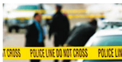
警方封鎖事發現場進行調查。