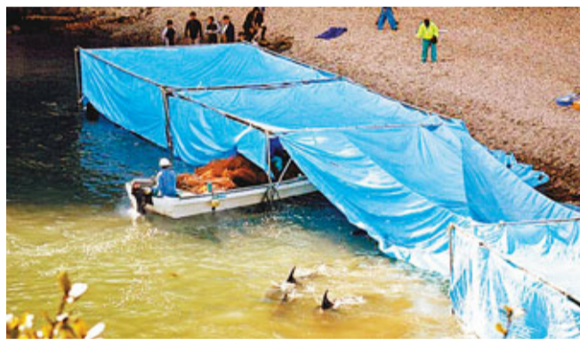
由於獵殺已引起關注，漁民現會躲於帳篷裡屠宰鯨豚。