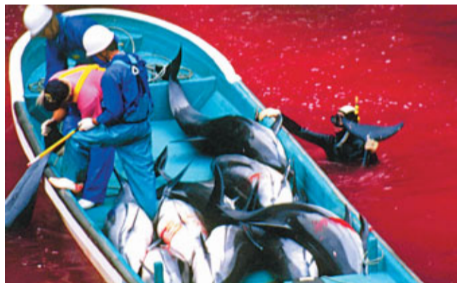
被捕殺海豚的血，染紅整個「海豚灣」。

由於反對者日眾，美國的水族館已停止買賣野生海豚，英國亦不再開押及訓練海豚作表演用途，歐洲部分地區仍有海豚表演，但用的是在館中出生的海豚。不過奧巴里指出，訓練自家海豚表演或衍生近親交配問題，呼籲大眾停止參觀有海豚的水族館及鯨豚類表演，從消費方面杜絕這門生意。 ■《每日郵報》