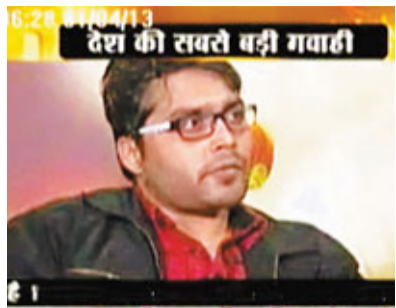
印度巴士輪姦案轟動全國，亦引發尼泊爾、斯里蘭卡、巴基斯坦及孟加拉等鄰國強烈反響，民眾抗議政府未有盡力保護女性安全。有示威者指，印度女性從不敢把強姦及家暴宣之於口，形容新德里抗議不絕叫人「大開眼界」，可鼓勵更多民眾爭取女性權益。尼泊爾一名21歲女子日前報稱被警員強姦及恐

嚇，然而禍不單行，她還遭一名移民局官員打劫，數百名民眾包圍首都加德滿都的總理府，要求政府推動法律改革，並改善婦女的社會地位。孟加拉有4名男子輪姦一名少女並拍成片段，完事後更將她棄於火車軌附近。警方雖已拘捕疑犯，但民眾擔心食腐風氣，加上警方和司法人員看不起女性，均令強姦犯得不到應有懲罰。