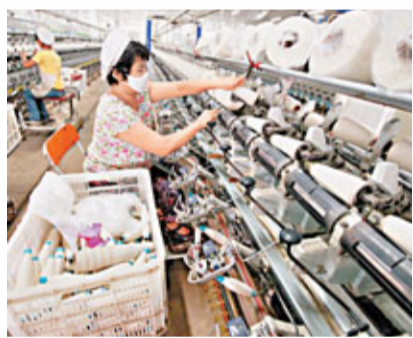
■新興市場勞工成本每年上升。圖為中國安徽省出口紡織企業。資料圖片

麥克納馬拉指，在亞洲設立一間有5,000名員工的工廠，僅需90日，但在美國建立相同規模的廠房，須符合嚴格監管，以及負擔更高稅務、醫保等成本，成事要有耐性。