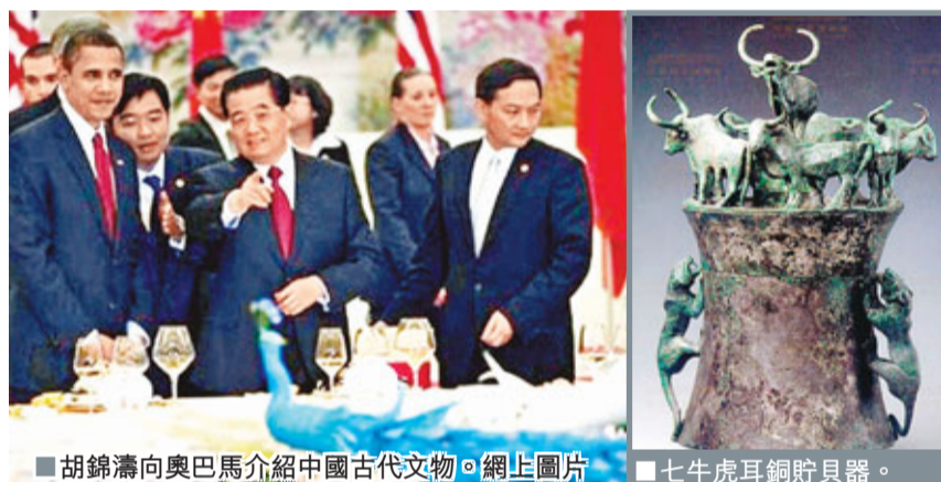
■胡錦濤向奧巴馬介紹中國古代文物。

其實，國際考古界認為中國的三大出土奇跡中，就包括晉寧石寨山出土的青銅器（其他兩項是河南安陽的殷墟和陝西的秦俑）。