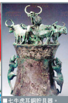
■七牛虎耳銅貯貝器。

自1955年至1996年，國家對晉城西約5公里的石寨山古墓葬進行5次發掘，清理86座滇國古墓，出土珍貴文物5000餘件（套），6號墓出土的金質「滇王之印」，印證了司馬遷《史記·西南夷列傳》所記載的漢武帝「賜滇王金印」