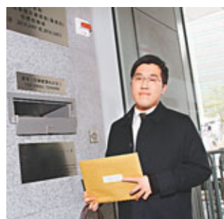
信置代表投標。