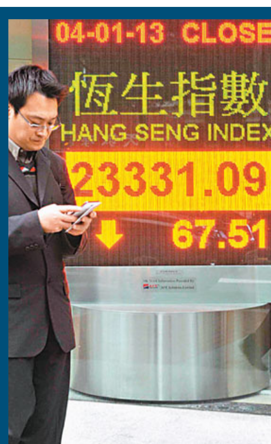
港股結束兩連升,昨一度跌226點,收挫67點,主成成交775億元。