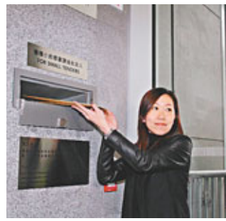
新世界代表投標。