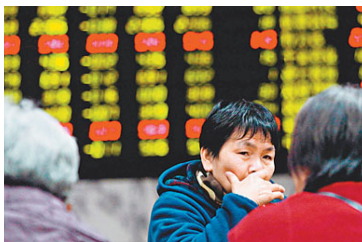
新年首個交易日A股高開低走,收市滬股上漲深股跌。

香港文匯報訊(記者 袁毅 上海報導)昨天是2013年首個交易日,滬股開門紅,深股則開紅收黑,成交基本持平。分析師稱,雖然上月市場強勁反彈,令短線獲利籌碼豐厚,但由於大市估值依然較強,預計大盤仍將維持上行趨勢,但亦不排除短線將橫盤整理。