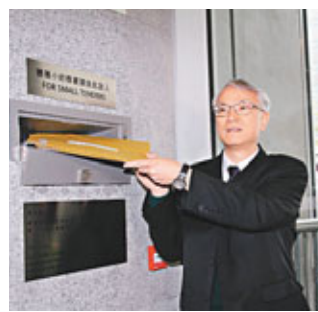
會德豐代表投標。