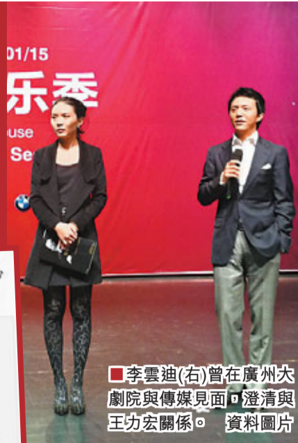
李雲迪(右)曾在廣州大劇院與傳媒見面，澄清與王力宏關係。資料圖片

李雲迪本人4日上午也在微博回應王力宏，強調兩人真的只是「好兄弟」，確定兩人都是異性戀，都愛女生。王力宏和李雲迪去年初在台灣中國電視台的春節晚會而認識，此後