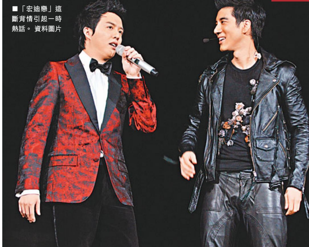
「宏迪戀」這斷背情引起一時熱話。資料圖片