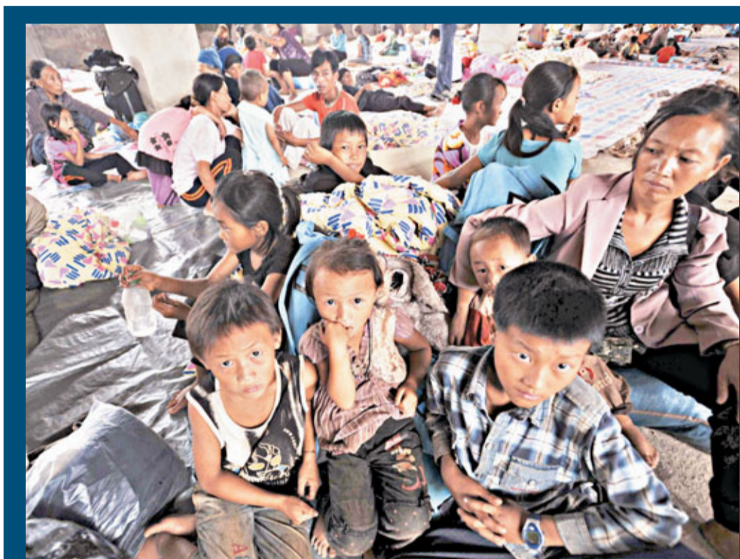
逾萬緬甸難民湧入雲南邊境，且多為婦孺。圖為2009年時緬甸果敢滯留中國雲南的難民。資料圖片

中國外交部發言人華春瑩昨日在北京表示，「中方已就此向緬方提出交涉，要求緬方立即採取有效措施，避免類似事件再次發生。緬北問題是緬甸內部事務，中方希望緬甸政府通過和平談判妥善解決緬北問題，維護中緬地區的安寧與穩定。」