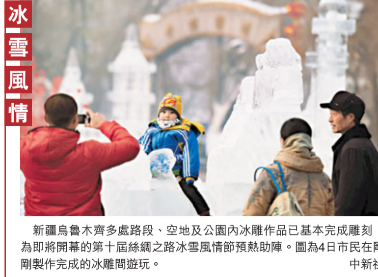
新疆烏魯木齊多處路段、空地及公園內冰雕作品已基本完成雕刻，為即將開幕的第十屆絲綢之路冰雪風情節預熱助陣。圖為4日市民在剛剛製作完成的冰雕間遊玩。

昨日，已被迫為烈士的尹進良、陳偉、尹智慧之遺體告別儀式在杭州市蕭山區殯儀館舉行，儘管天氣寒冷、交通不便，但仍有近500名市民冒著大雪為英雄送行。殯儀館外停著的接送車車身上統一貼上了印有「我們永遠懷念您」字樣的橫幅，殯儀館門口兩側也擺滿了社會各界人士送來的花圈。接送車和花圈上都已積上薄雪，現場群眾打出「消防英雄，一路走好」的橫幅。