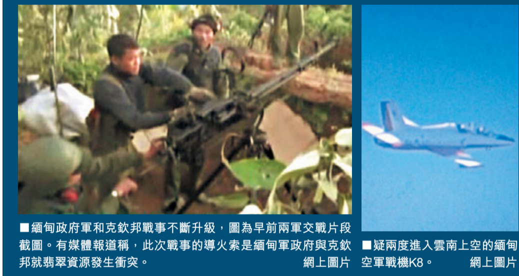
緬甸政府軍和克欽邦戰事不斷升級，圖為早前兩軍交戰片段截圖。有媒體報道稱，此次戰事的導火索是緬甸軍政府與克欽邦就翡翠資源發生衝突。疑兩度進入雲南上空的緬甸空軍戰機K8。