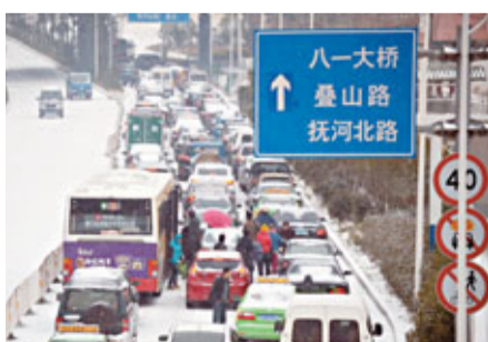
在江西南昌一處隧道口，4日因道路上行車緩慢，不少市民下車步行。

香港文匯報訊 新華社消息：截至4日17時，南方電網114條輸電線路出現覆冰，該公司已發佈低溫凍冰災害藍色預警，積極採取融冰措施，目前電力供應平穩有序。