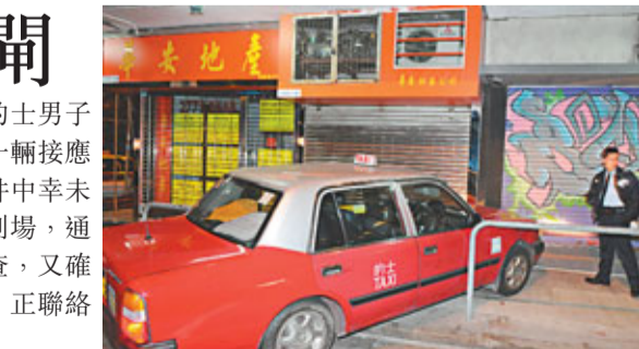
■的士撞毀大閘，警員到場調查。

香港文匯報訊 (記者 杜法祖) 油麻地文苑街再發生刑事毀壞案。繼去年8月街上有2間地產代理店遭人淋油破壞後，附近一間生果店捲閘昨凌晨又遭人駕的士撞毀，駕車者隨即棄下的士逃去。警方正深入調查及進行車動機，以及連串破壞事件是否有關連。事發昨凌晨3時，有街坊目睹一輛的士在文苑街衝上行人路，撞向一間生果店的捲閘，而停泊附近一輛私家