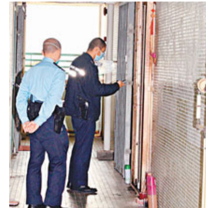
▲警員在龍裕樓發現腐屍單位調查。