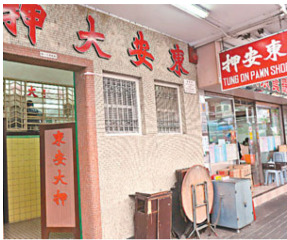
■發生贖當奇聞的當舖。

按照港九押業商會的合約規定，香港的當舖之月利率為3.5%。物品一經抵押，可以在4個月內清還本利以贖回，4個月後抵押者可以藉清還利息以延續當期。若不續期，抵押品就會歸當舖所有。有熟悉當舖行業人士指事件「離奇」，他指若疑人取贖後再將戒指變賣，很難有利可圖，加上當舖利息甚至會「蝕本」，故難以理解其動機。