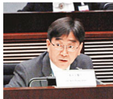
高永文在立法會回應議員提問。

食環署署長梁卓文指署方已抽查市面90個食油樣本，當中超過60個已完成化驗，4個樣本BAP含量超標，其餘滿意。就山東油商向本港供應有問題食油，梁卓文說，國家質檢總局已勒令油商停產和改善衛生，食安中心在回收行動後再巡查市面，已再無發現有問題的食油。至於早前驗出含致癌物BAP的一批金帝濃香花生油，當局已經全面回收並已運回內地，工聯會立法會