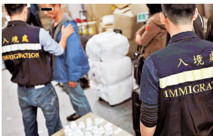
入境處昨日聯同警方拘捕35名涉嫌水客。

香港文匯報訊(記者 郭兆東) 「風沙行動」打擊水貨客再顯成效，入境處昨日聯同警方合共動員113名執法人員，在上水資料中心拘捕35名年齡介乎20歲至61歲，涉嫌非法從事水貨活動及違反逗留條件的內地旅客；同