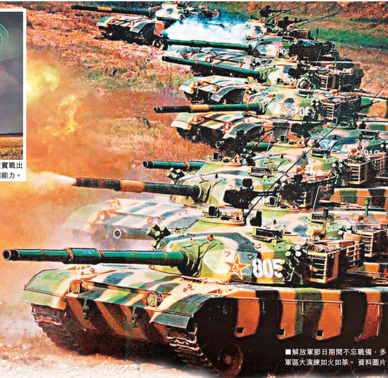
■解放軍節日期間不忘戰備，多軍區大演練如火如荼。資料圖片

香港文匯報訊(記者 劉坤領 北京報道)新年期間各地民眾或放假或出遊，盡情享受假日的悠閒，但解放軍節日期間卻不忘戰備，大演練如火如荼。北起瀋陽軍區、濟南軍區、南京軍區，南至三沙海域，解放軍假期期間一系列軍事演練接連上演，實兵實裝，檢驗部隊快速反應能力，並保持優良的戰備狀態。各部創新一體化指揮，具備同時處理多種突發情況能力。