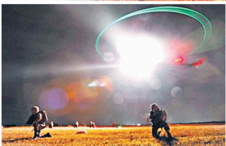
2日，南京軍區某陸航團與步兵一起展開夜間機降訓練。該團從實戰出發，組織部隊在夜間進行實兵、實裝、實降演練，檢驗部隊快速反應能力。