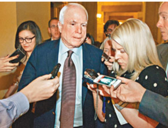
共和黨前總統候選人麥凱恩指兩黨商討債限將有「好戲上演」。