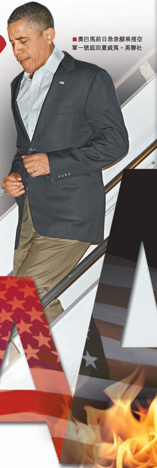
奧巴馬前日急急腳乘搭空軍一號返回夏威夷。