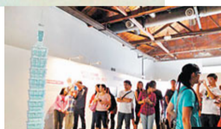
■《台北101》模型吸引觀眾駐足圍觀。