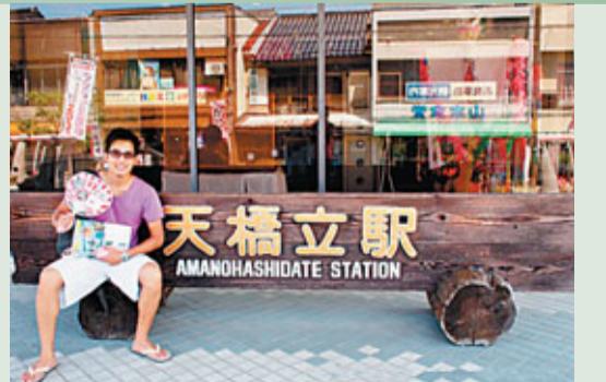
■富有特色的天橋立火車站。