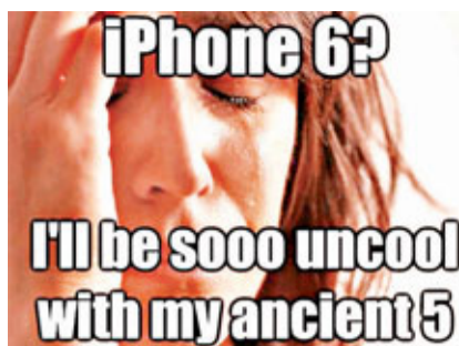
有科技網揶揄：「拿着iPhone5很快就不型了。」網上圖片