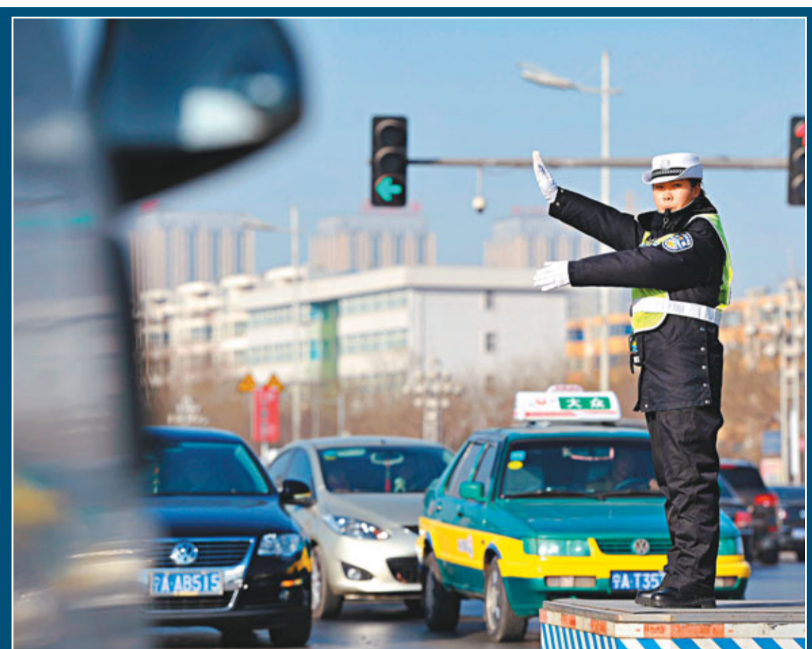
「史上最嚴交規」施行至今，闖黃燈扣六分規則引發民眾爭議。

此外，有關專家指出，針對搶黃燈、撥打電話、不繫安全帶等違規現象，是人工作現場處罰還是電子攝錄事後補罰，如何才能做到有據可罰，還沒有統一辦法，還是個盲區，需要地方盡快出細化辦法。