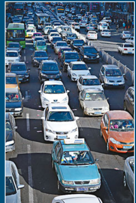
新交規對闖紅燈、遮擋號牌、超速駕駛等交通違法比以往處理更為嚴格。