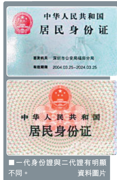
一代身份證與二代證有明顯不同。