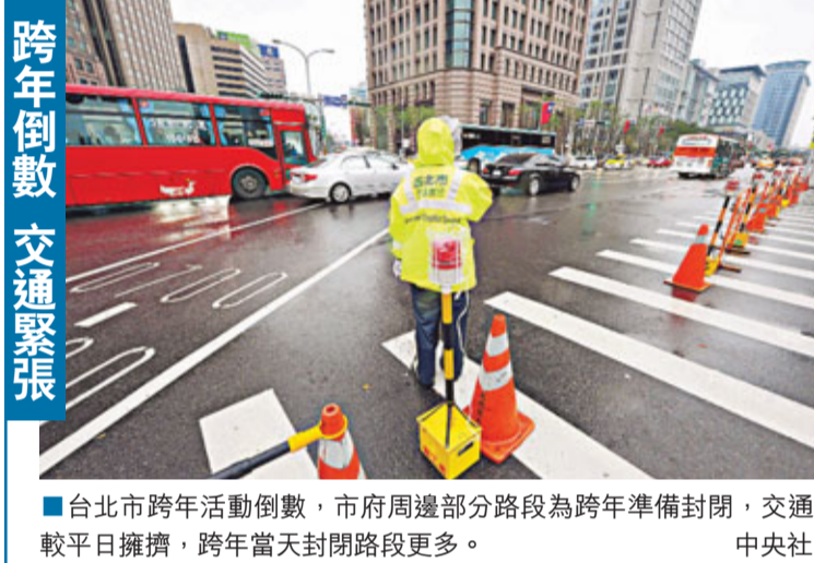
跨年倒數 交通緊張

高孔廉認為，胡錦濤在十八大的報告中，認為要「探討國家尚未統一特殊情況下的兩岸政治關係並對此作出合情合理安排」，國台辦主任王毅隨後解釋，認為不強加於人為合情合理。