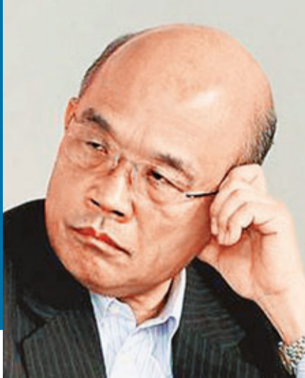
蘇貞昌早前提出的「大陸事務委員會」目前面臨難產。

辜寬敏當日下午出席台灣教授協會活動時表示，現在人民不信任馬英九，但民進黨支持度也沒爬升，呼籲民進黨「要自己想辦法成長」。他批評現有的民進黨領導層未能認真思考兩岸關係，呼籲民進黨主席蘇貞昌應盡快思考有關