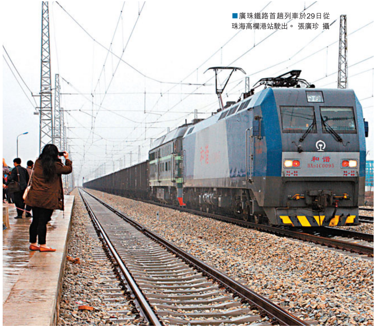
■廣珠鐵路首趟列車於29日從珠海高欄港站駛出。

貨物運輸適合時效性要求不高的重貨運輸。有分析指，廣珠鐵路投入運行後，將承擔廣州鐵路樞紐西部通道的功能，改變珠江口西岸無貨運鐵路的狀況，使珠江三角洲西翼地區更加充分發揮背靠內陸，面對港澳的地緣優勢，以廣珠鐵路為紐帶，加強與澳門的全方位合作，實現粵澳兩地經濟繁榮。而未來港珠澳大橋建成後，亦將進一步促進粵港澳三地物流發展。