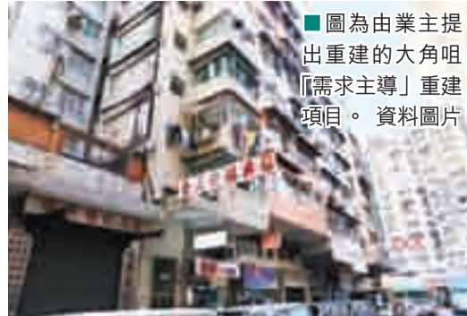
圖為由業主提出重建的大角咀「需求主導」重建項目。

香港文匯報訊(記者 黃嘉銘)市場一直議論紛紛的打擊樓市「雙辣招」法例昨正式刊憲,以引入適用於香港永久居民以外的任何人士(包括公司)取得住宅物業的買家印花稅(BSD),以及加強版額外印花稅(SSD),條例草案將於下月9日提交立法會。若草案獲得通過的話,將適用於在本年10月27日或以後取得的住宅物業。而根據修訂草案,非香港永久居民持有的物業,若因被市建局收樓或被強拍而需重新置業時,可獲豁免繳付BSD。政府向立法會提交《2012年印花稅(修訂)條例草案》當中,BSD稅率劃一為15%。但政府未有接納發展商的建議,豁免本地公司買家繳付BSD,運輸及房屋局日前更表明難以制定一套能有效堵塞所有可見漏洞的機制,為免影響BSD成效,故維持BSD應適用於所有公司。