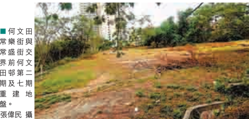
何文田常樂街與常盛街交界前何文田邨第二期及七期重建地盤。

目將建豪宅,買家有不少均為公司名義及非本地買家,料BSD的風險將於入標價反映。翻查資料,同區最近一次有大型豪宅官地賣出,為2010年6月,新地以109億元拍賣投得何文田佛光街與忠孝街交界地盤,為歷來第三貴的官地,可建樓面達869,247方呎,每呎地價約12,540元,不過地盤鄰近日後的何文田港鐵站,地理位置較今趨招標的同區地皮優勝。目前地王首位為信置97年以118.2億元投得小西灣地王,第二位為長實2011年以116.5億元投得的半山波老道地皮。