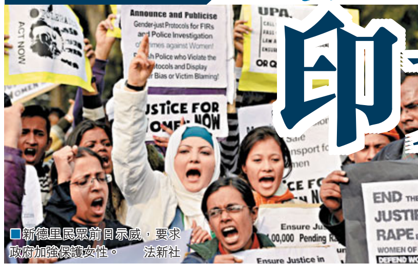
新德里民眾前日示威，要求政府加強保護女性。