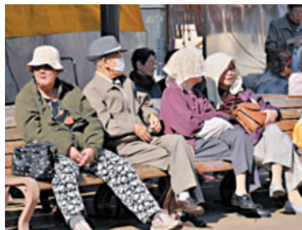
日本人口老化問題嚴峻。資料圖片