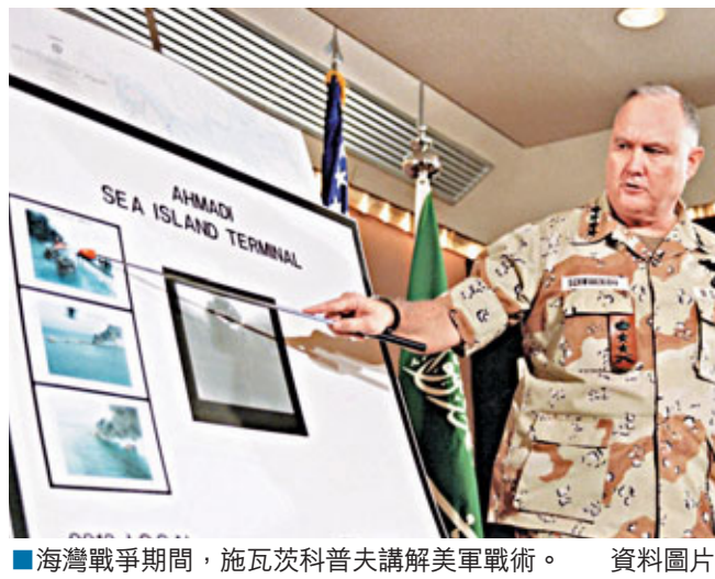
海灣戰爭期間，施瓦茨科普夫講解美軍戰術。資料圖片

1991年海灣戰爭中的聯軍指揮官、美國退休四星上將施瓦茨科普夫日前因肺炎併發症在家中病逝，享年78歲。白宮及國防部高度評價其一生。當年發起聯軍阻止伊拉克入侵科威特的前總統老布什，亦於病榻上發聲明致哀，形容施瓦茨科普夫是「偉大軍事領袖」和「真正的愛國者」。