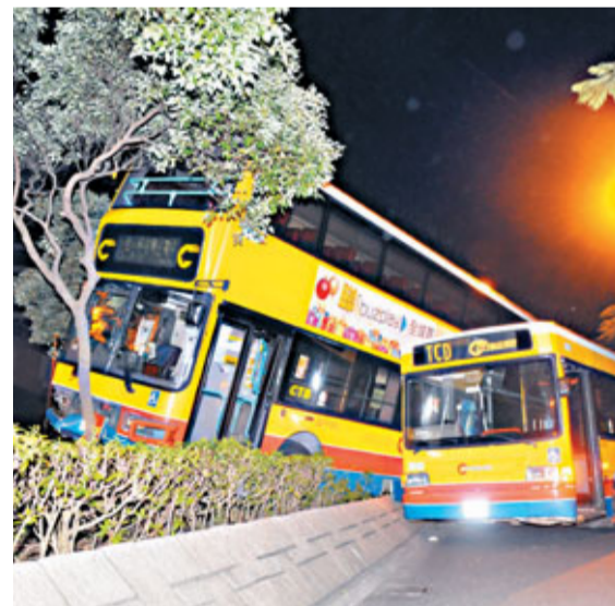
■雙層巴士在東涌順東路失事翻上花槽有翻側危險，城巴安排單層巴士「頂住」。