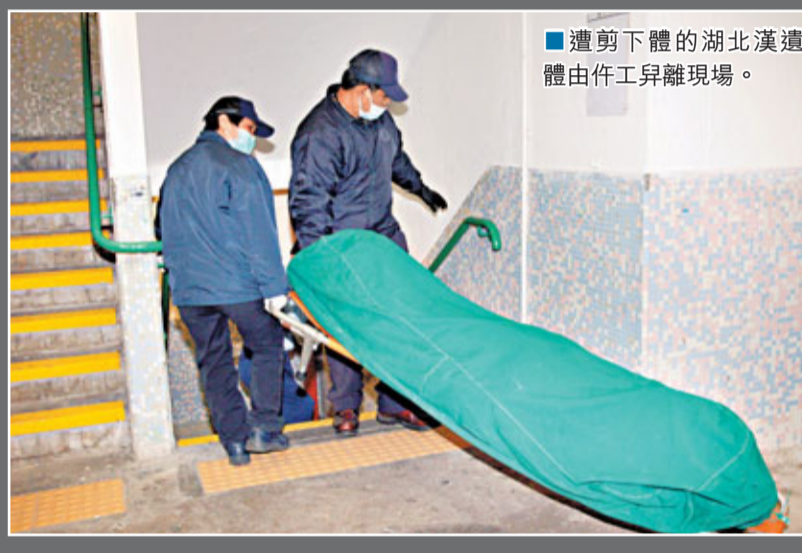
■遭剪下體的湖北漢遺體由伴作工移離現場。