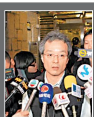
▲東區刑事總督察周少棠形容案件是家庭暴力事件。