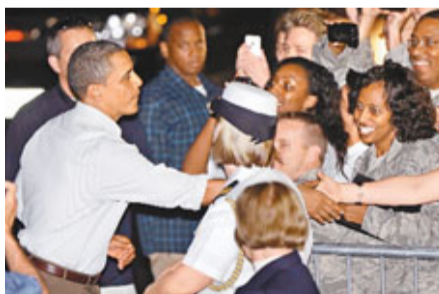
奧巴馬離開夏威夷結束休假前，會見當地美軍。

分析指，債務上限預料令民主、共和兩黨就稅收與開支的爭辯進一步激化。總統奧巴馬為加速財部談判，提議將債務上限容後再議，但共和黨則視之為逼