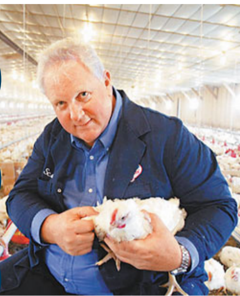
Bell & Evans在雞隻飼料加入牛至油及少量肉桂，頗有成效。

中國內地早前爆出「速成雞」事件，令人關注向家禽餵飼抗生素和激素促進生長的問題。在美國，不少雞肉生產商也會在飼料加入抗生素抗菌，不過使用過量可能產生抗藥性「超級病菌」，危害人類健康，當地有雞農就嘗試引入有機養殖，使用「牛至油」取代抗生素，讓顧客吃得放心。