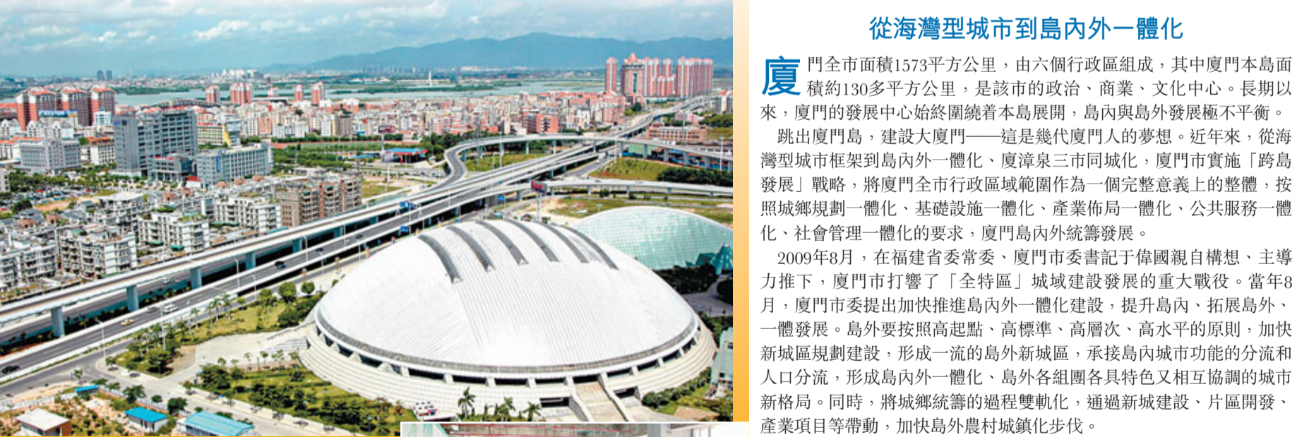
島外新城集美城區新貌 資料圖片