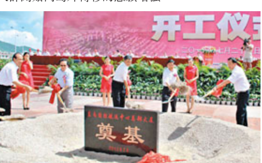
廈門島外投資比重已超本島。圖為今年7月，廈門市大手筆投資160億元人民幣，動工興建東南國際航空中心18個項目。

只到城市消費的傳統。從居住功能來看，人口呈現向島外城區轉移的特徵，隨着島內城區居住成本、生活成本的提高，部分中心城區的居民開始向島外轉移。島外也出現許多優於中心城區的大樓盤，據統計，2011年廈門市商品住宅銷售量為273.41萬平方米，其中島外銷量佔總量的64.8%，顯示廈門市人群開始向島外轉移的意願增強。