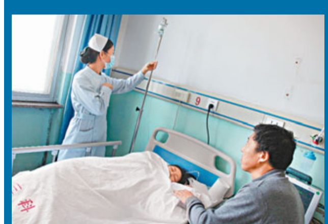
23名學生中有13人住院治療，目前暫無生命危險。新華社