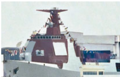
網上流傳的052D導彈驅逐艦懸掛滿旗。

時事評論員張斌指出,中國大型水面艦艇的研製與裝備,是一個長期的計劃,不可能用某一個型號來在具體的一個事件上對它(日本)釋放信號,但他同時認同「052D下水是中國國防發展中一個比較重要的事件,它向外界,當然也包括日本,釋放了中國加強海軍建設的信息,這裡面確實有一層威懾的作用」。