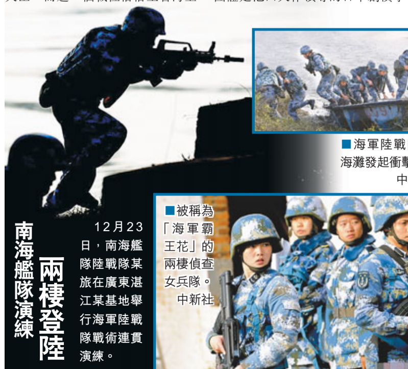
海軍陸戰隊向海灘發起衝擊。

此外,人民網援引日本《讀賣新聞》網站報導,針對今後是否會參拜靖國神社,安倍政權表示將不參加來年春季的例行參拜活動。安倍政權將謀求實施平穩的外交政策。