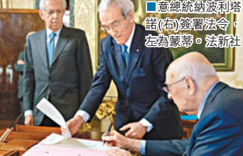
意總統納波利塔諾(右)簽署法令，左為蒙蒂。