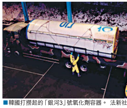
韓國打撈起的「銀河3」號氧化劑容器。