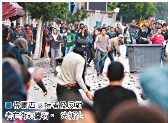
穆爾西支持者及反對者在街頭擲石。