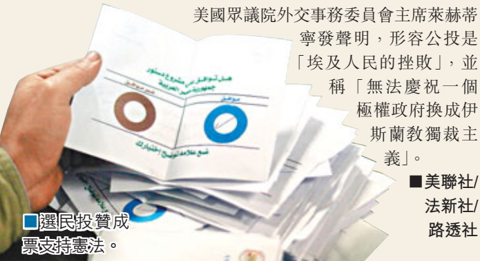
選民投贊成票支持憲法。