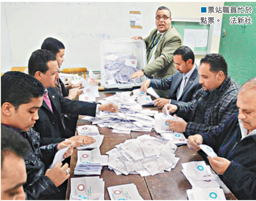
票站職員忙於點票。