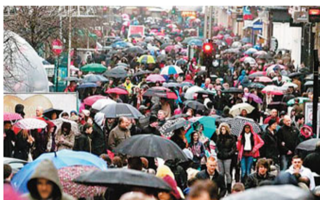
■倫敦購物區塞滿購物人潮。

英國商戶趁聖誕節前夕減價促銷，吸引數以百萬計消費者掃貨，預料今天「狂熱星期一」零售額將達13億英鎊(約163億港元)，較去年多出3億英鎊(約37.6億港元)。但與此同時，慈善機構Trussell Trust估計，在今年聖誕前後兩周，須接受食物銀行救濟的英人將較去年增加1倍，達1.5萬人。