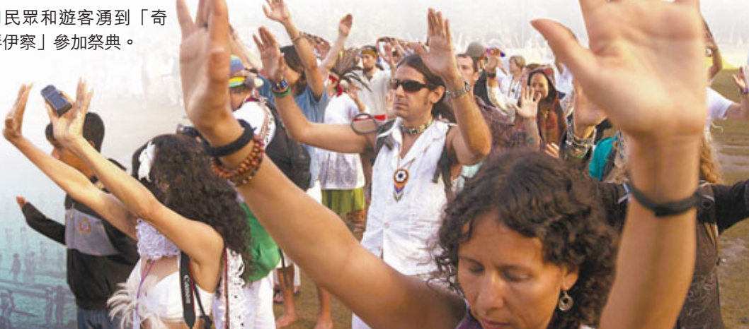
■民眾和遊客湧到「奇琴伊察」參加祭典。