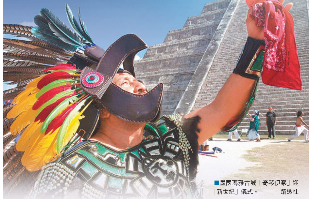
■墨西哥瑪雅古城「奇琴伊察」迎「新世紀」儀式。路透社

2012年12月21日香港時間晚上7時12分已經過去，所謂瑪雅曆法「世界末日」最終沒有來臨。昨日為了迎接「末日」，全球各地都有民眾前往墨西哥、法國等地朝聖，或是聚集舉行末日前狂歡派對，結果世界依然一樣，生活一切如常，未知最初花費巨額金錢準備迎接末日的「末日信徒」，如今有何打算？