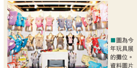
圖為今年玩具展的攤位。資料圖片

香港文匯報訊(記者 黃詩韻) 香港玩具展、香港國際文具展以及香港嬰兒用品展將於2013年1月7至10日舉行,逾2,500家參展商將展示產品,當中包括把虛擬影像混合到現實環境的擴增實境(Augment Reality)玩具槍,只要把床上下倒轉即化身書桌的嬰兒床書桌,由無木藥專利物料製成的環保記事簿, iPad遊戲棋盤、智能便盆(Intelligent Potty)等。