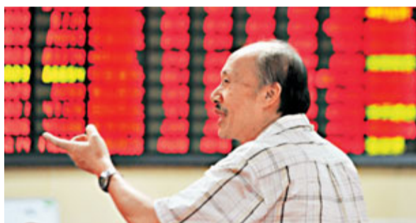
中金料A股明年首季有望反彈10%至15%。圖為內地股民在證券營業大廳關注股市行情。

香港文匯報訊(記者 方楚茵) 中金研究部聯席負責人、首席策略師兼董事總經理黃海洲在出席記者會時指,明年H股表現仍優於A股,而A股明年底的目標為