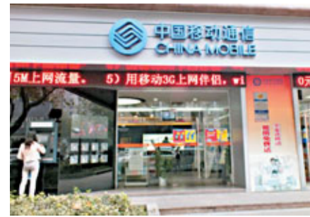
中國移動通信營業廳LED屏幕滾動宣傳3G網絡服務。資料圖片