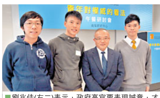
劉兆佳(右二)表示,政府高官要表現誠意,才能得到青年人的支持。

少年對高官持負面態度,個別官員的表現以至宏觀經濟環境和失業率均有影響,有關現象於世界各地均屬普遍,「當政治開放,青年人對政府的要求愈來愈多,但政府未必有資源滿足所有人,對政府信任和尊重的程度自然減弱。」但他亦提醒,高官應保持個人操守,而最重要是表現解決問題的誠意、知識和能力,才能得到青年人的支持。