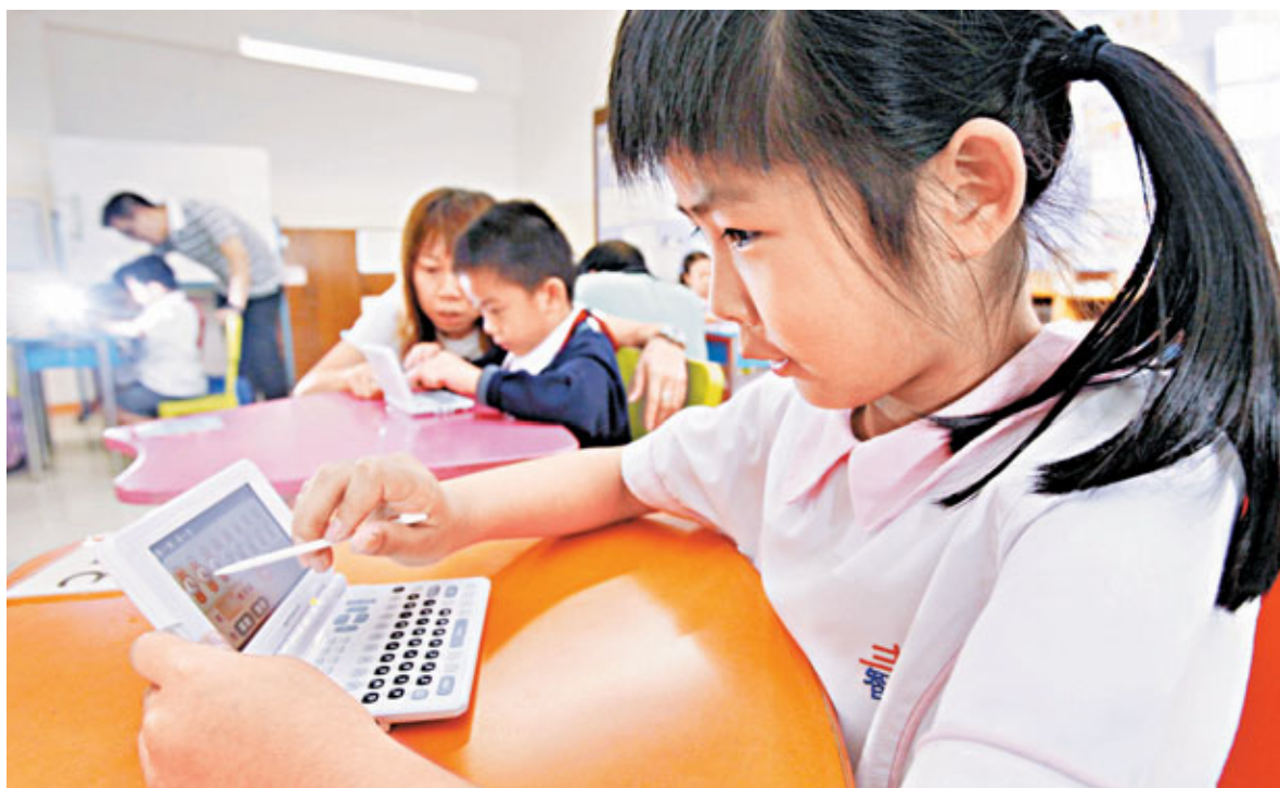
「電子教科書市場開拓計劃」最快可於明年3月進行試教工作,但教育局目前仍未和開發機構簽約。圖為小學生用電子書上課情況。

香港文匯報訊(記者 歐陽文倩)教育局上月公布「電子教科書市場開拓計劃」審批結果,惟仍未公布相關推行細節。本報得悉,當局日前已舉行簡報會,向各「中標」開發機構和夥伴學校講述計劃內容。據了解,電子書最快可於明年3月進行試教工作,教育局會為約80多所學校準備無線上網硬件配套,每校並借出16台平板電腦以作支援。不過,局方現時仍未與各電子書開發機構簽約,令開發難以招聘人手開展工作;另其中2所開發商轉為非牟利機構的申請也未完成,試教及計劃的推展或仍有變數。